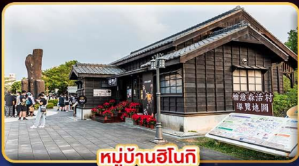
หมู่บ้านฮินเกี

"ไทเป" มหานครแห่งเมืองสีัน เทียวจู่ใจ เซ็คอินจุดไฮไลท์