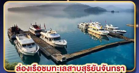
ล่องเรือชมทะเลสาบสุริยันจันทรา