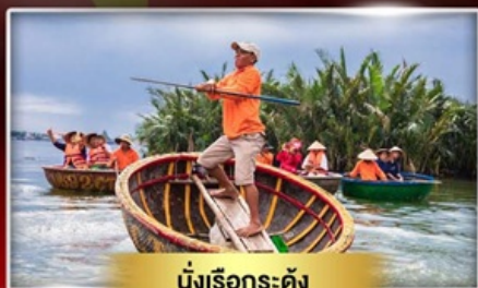
นั่งเรือกระดง