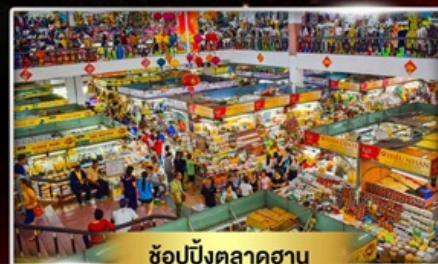
ช้อปปิ้งตลาดฮาน