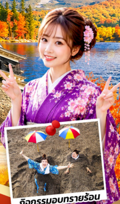
กิจกรรมอบทรายร้อน

สนุกกับกิจกรรม อบรมทรายร้อน นั่งเฟอร์รี่สู่เกาะซากุระจิมะ นั่งรถไฟชินคันเซ็นจากเมืองคาโกชิม่าสู่เมืองฟุกุโอกะ