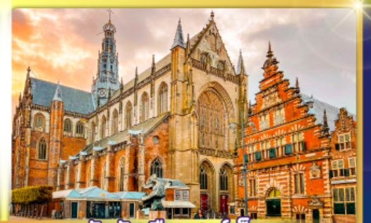
จัตุรัสเมืองฮาร์ลิม

พรมแดนเมืองเปลกาเนเธอร์แลนด์และเบลเยียม เดินเมืองเคลฟท์ เมืองเครื่องปั้นดินเผาระดับโลก ฮาร์ลิมเมืองมั่งคั่งที่สุดของเนเธอร์แลนด์