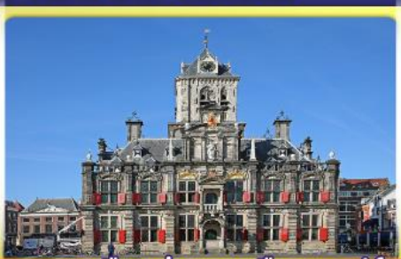
อาคารเมืองเก่าคลองเมืองเคลฟท์