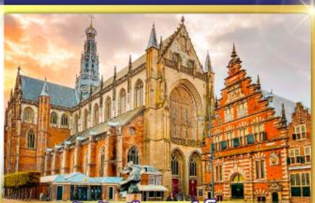
จัตุรัสเมืองฮาร์ลิม

พรมแดนเมืองเปลาเกเนเธอร์แลนด์และเบลเยียม เติมนเมืองเคลฟท์ เมืองเครื่องปั้นดินเผาระดับโลก ฮาร์ลิมเมืองมั่งคั่งที่สุดของเนเธอร์แลนด์