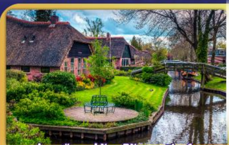
ล่องเรือหมู่บ้านไรทอนทีธูร์น