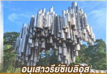
อนุสาวรีย์ซีเบลึส