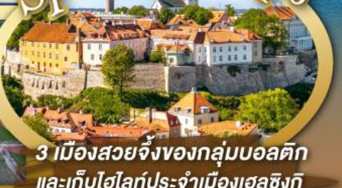
3 เมืองสวยจิ้งของกลุ่มบอลติก และเก็บไฮไลท์ประจำเมืองเฮลซิงกิ และล่องเรือเฟอร์รี่ข้ามประเทศ

ไฮไลท์ในโปรแกรม • เที่ยวสามประเทศหลักกลุ่มบอลติก • ชมเมืองหลวงวิลนิอุส ประเทศลัตเวีย