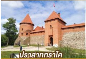
ปราสาททราโค