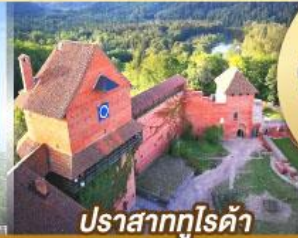
ปราสาทกูไรต้า