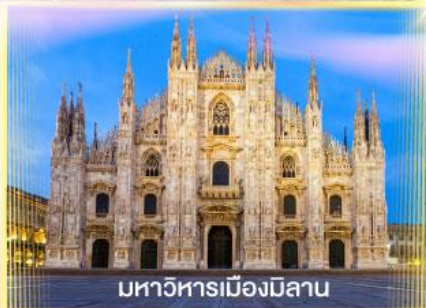
มหาวิหารเมืองมิลาน