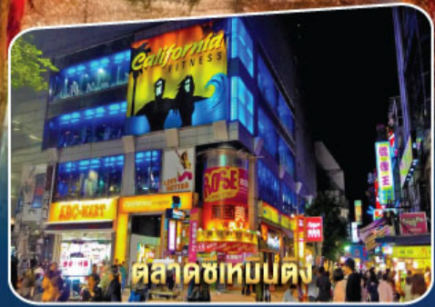
ตลาดซีเหมินตง