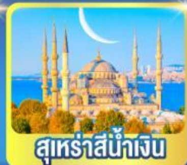
สุร่ายน้ำเงิน