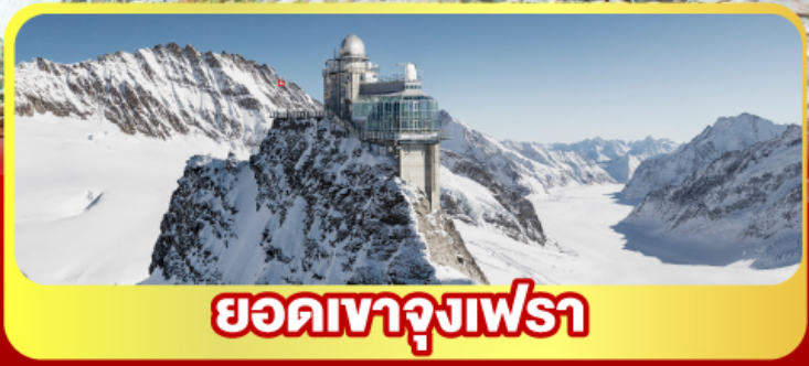
ยอดเทาจุงเฟรา