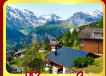
หมู่บ้านเมอร์ริเซน