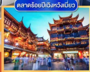
ตลาดร้อยปีเมืองหวิงเหมียว