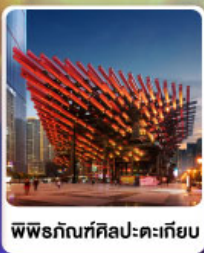
พิพิธภัณฑ์ศิลปะตะเกียบ