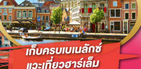
จัตุรัสโรมอน