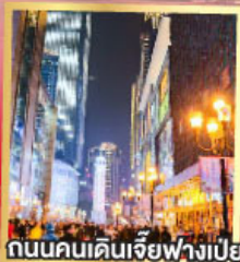
ถนนคนเดินเจียวฟางเป่ย์