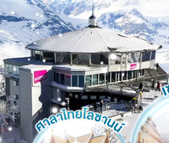
ศาลาไทยไลซานน์