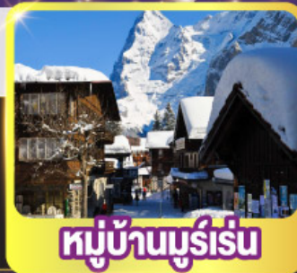
หมู่บ้านมูร์เร็น