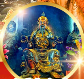
วัดปักโตฮองฮำ