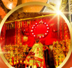
วัดเจ้าแม่กวนอิมฮองฮำ (สวนหนานหลิน)