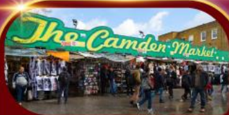
ตลาดแคมเดน