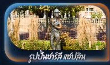
รูปปั้นชาร์ลี แชปลิน

เที่ยวครบจบทุก Highlight ตะลุยจุงเฟรา วิวอลังการจัดเต็มสมชื่อ Top Of Europe สักครั้งในชีวิตหมู่บ้านเซอร์แมท นั่งรถไฟสาย Gornergrat bahn หมู่บ้านเลาเทอร์บรุนเนินสวยเหมือนเทพนิยาย เปิดประสบการณ์โรแมนติกส่องเรือทะเลสาบรุน ทะเลสาบเจนีวา น้ำพุจรวดเจ็ทโต ศาลาไทย รูปปั้นชาร์ลี แชปลิน The Fork ปราสาทซิลยอง หมู่บ้านอิซลทอวอลด์ สิงโตแกะสลัก สะพานไม้ชาเปล โบสถ์ฟรอมุนสเตอร์ ซ็อบป์นิงจุงเกนบนบานไอฟพตราเซอร์