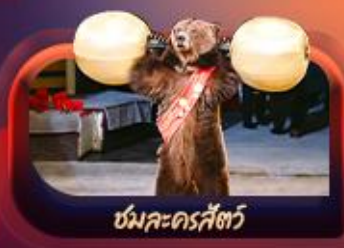
หมีละครสัตว์