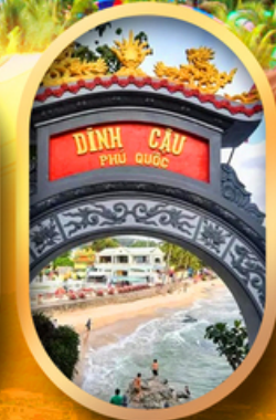
ศาลเจ้าติงเกา