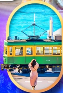
ถนนโคมาจิโคริ