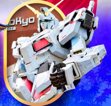
ห้างไอโดปะกันดั้ม