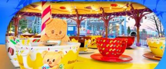
Fuji q Highland x Butterbear เดินทาง พ.ศ. 69 เป็นต้นไป