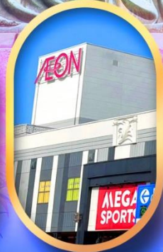
อีออนมอลล์