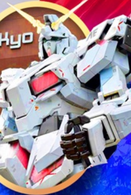
ห้างไอโดบะกันดั้ม