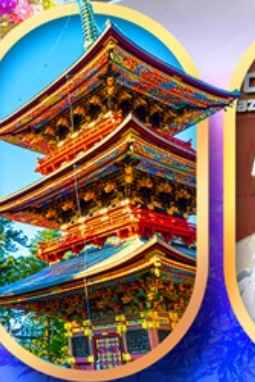
วัดนาริตะซัน