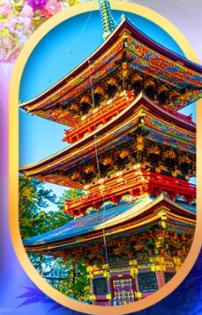
วัดนาริตะซัน