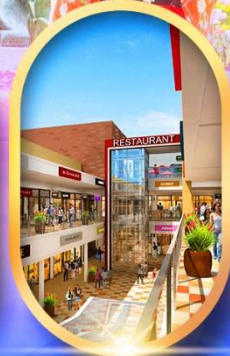
บิตซูเอ็กซ์พรีเซนต์