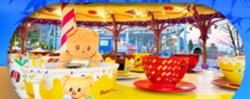
Fuji q Highland x Butterbear เดินทาง พ.ค. 69 เป็นต้นไป