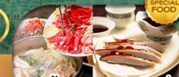
เมนู: สุกี้มองโก + เปิดปักกิ่ง เดินทาง เม.ษ. - ต.ค. 69