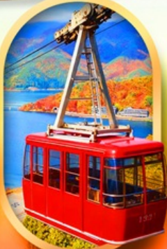
ขึ้นกระเช้าทะเลสาบมิกะตะ