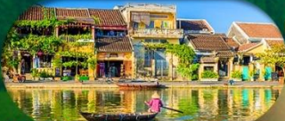
HoiAn Ancient Town ย่านเมืองเก่าฮอยอัน