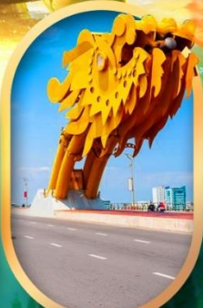
สะพานมังกรดานัง