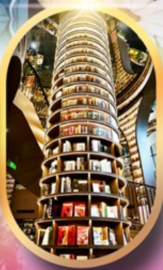
หอหนังสือจงซูเก้อ