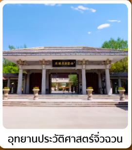
อุทยานประวัติศาสตร์จิวจวน