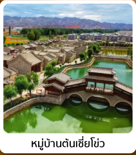
หมู่บ้านตันซีซิว