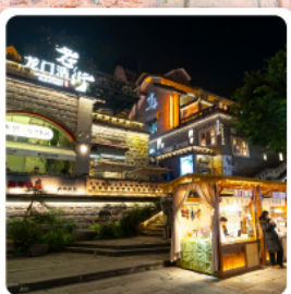
ตลาดโบราณหลงเหมินฮ่าว

ไฮไลท์ อุทยานเขานางฟ้า อุทยานแห่งชาติหลุมฟ้า 3 สะพานสวรรค์ ผาหินแกะสลักตัวจู้ เขาป่าตึงชาน มรดกโลกระดับ 5 A