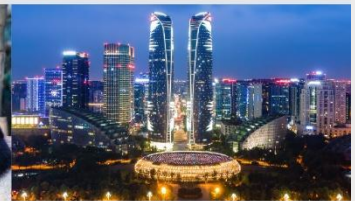
ตึกแฝดเจียงตู

*ทางบริษัทฯ ขอสงวนสิทธิ์ในการสลับโปรแกรมทัวร์ตามความเหมาะสมขึ้นอยู่กับสถานการณ์หน้างาน โดยคำนึงถึงผลประโยชน์ของลูกค้าเป็นสำคัญ