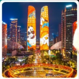
ตึกแฝดเจิงตู