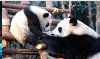
หุบเขาแพนด้าตูเจียงเอี้ยน