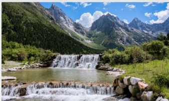
อุทยานแห่งชาติปี่เฟิงโกว