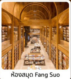
ห้องสมุด Fang Suo