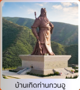
บ้านเกิดท่านกวนอู