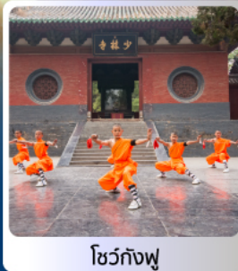
โชว์กังฟู