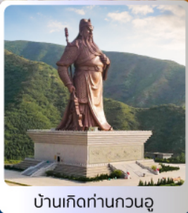
บ้านเกิดท่านกวนอู

อาหารมือพิเศษ บุฟเฟ่ต์ สุกี่หม้อไฟ เปิดปิกกิ้งซือาน