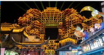
ตีทมห้ศจสรย 72