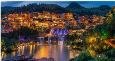
หมู่บ้านโบราณฟูหรงเจิน