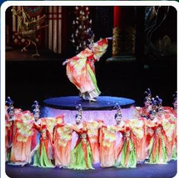
โง้ว FOSHAN QIANGUING