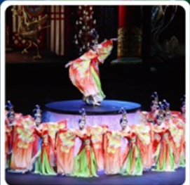
โชว์ FOSHAN QIANGQING