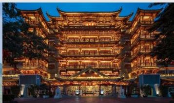
วัดต้าฝ่อซื่อ