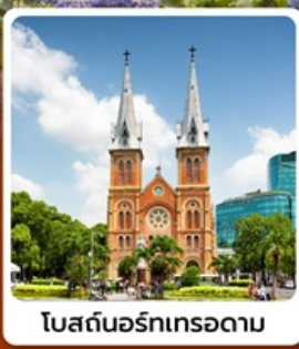
โบสถ์นอร์ทเทรอดาม