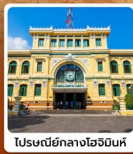
ไปรษณีย์กลางโฮจิมินห์