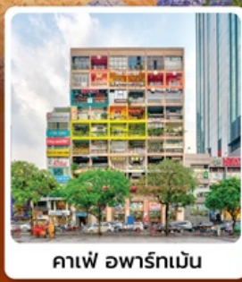
คาเฟ่ อพาร์ทเม้น