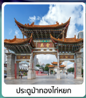
ประตูน้ำทองไค่หยก