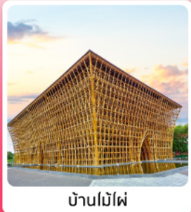
บ้านไม้ไฟ

ไอโกล์ เทียวครบ สวนน้ำ Aquatopia & สวนสนุก Vin Wonder เวนิสแห่งเวียดนาม Grand World Phu Quoc แลนด์มาร์คสุดโรแมนติก