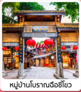
หมู่บ้านโบราณฉือซีโฮว