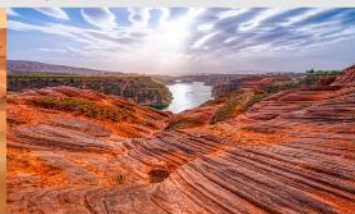
อุทยานหุบเขาคีลิน

*ทางบริษัทฯ ขอสงวนสิทธิ์ในการสลับโปรแกรมทัวร์ตามความเหมาะสมขึ้นอยู่กับสถานการณ์หน้างาน โดยคำนึงถึงผลประโยชน์ของลูกค้าเป็นสำคัญ