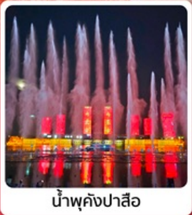
น้ำพุคังปาสือ