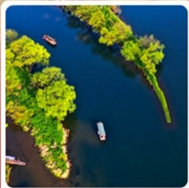
อ่าวพระจันทร์