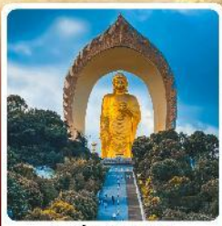
พระใหญ่ตงหลิน