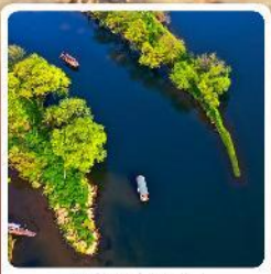
อ่าวพระจันทร์