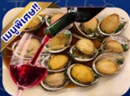
ชิฟู๊ด ฟ้าอื้อโฮบิต่าง