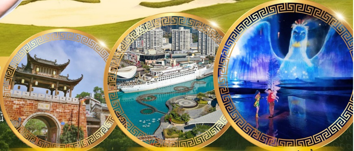
Gankeng Hakka ท่าเรือ Sea World การแสดงม่านน้ำ

ติกอล์ฟจัดเต็ม 2 วัน สนาม Mission Hills Golf Club ถนนคนเดินตงเหมิน ถนนคนเดินเป่ย์จิงลู่ ชมการแสดงม่านน้ำ ท่าเรือ OCT Harbour ซุปpingท่าเรือ Sea World ชมเมือง Gankeng Hakka เมืองกวางโจว หรือ กวางเจา