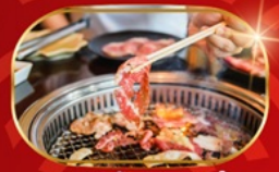
บุฟเฟ่ต์ปิ้งย่าง ไม่อั้น