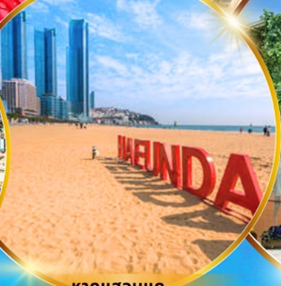
หาดแฮนแด