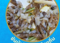
ชั้นนักจ๊อ อาหารท้องถิ่น