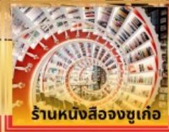
ร้านหนังสือจุกเก๋