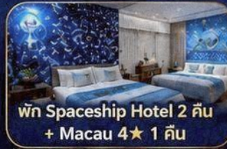
พัก Spaceship Hotel 2 คืน + Macau 4★ 1 คืน