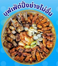
บุฟเฟ่ต์ปิ้งย่างไม่อื่น