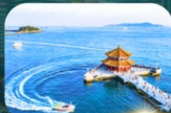
สะพานฉานเจียว