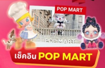
เช็किन POP MART