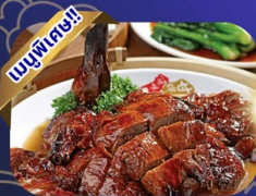
เป็ดย่างฮ่องกง