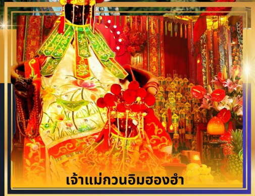
เจ้าแม่กวนอิมของอ่ำ