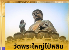
วัดพระใหญ่โป้หลิน