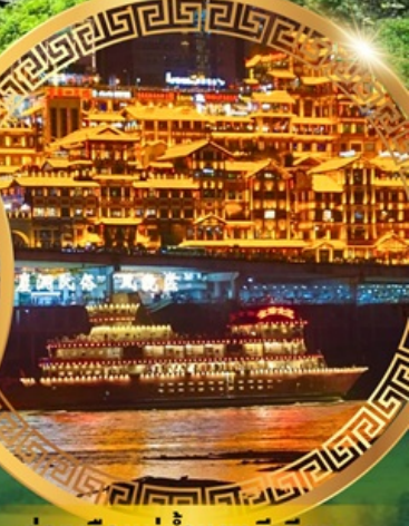
ล่องเรือแม่น้ำแยงซีเกียง

อุทยานแห่งชาติหลุมฟ้าสะพานสวรรค์ ระเบียงกระจก อุทยานเขานางฟ้า ใต้เจียเซียง ห้างการ์เด็นควางหวน พระพุทธรูปแกะสลักหิน หมู่บ้านโบราณฉือชี่ไช่ ชมรถไฟฟ้าทะลุตึก ตึกหุยชิ่ง ตึกตะเกียบ ถนนคนเดินเจียฟางเป่ย์ ล่องเรือแม่น้ำแยงซีเกียงวิวคำคิน อิสระช้อปปิ้งหงหยาดัง